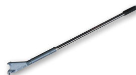
222219.900 Universal dækselnøgle